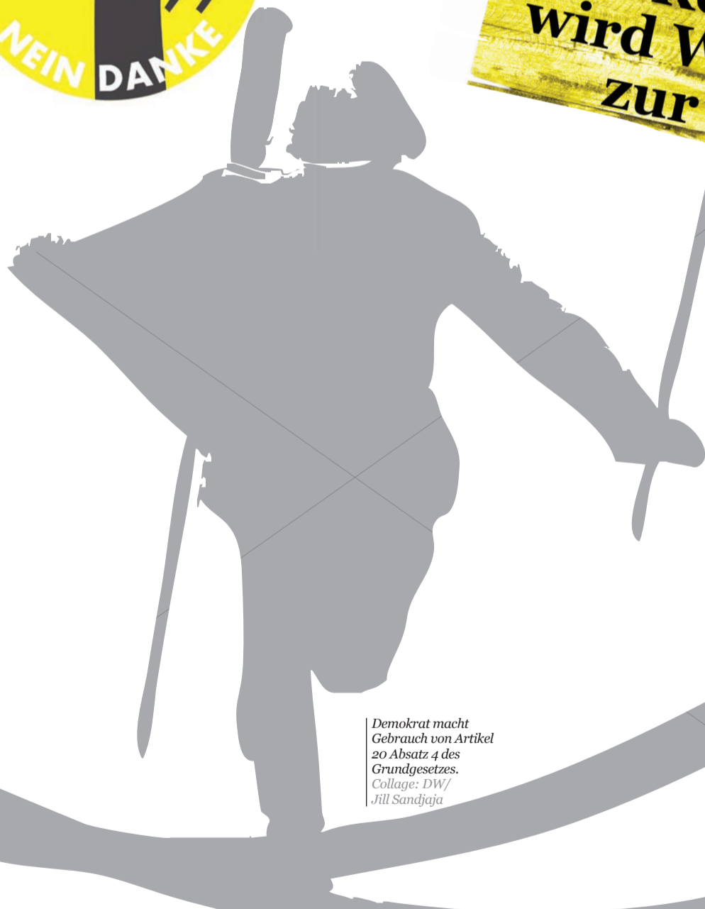
Demokrat macht Gebrauch von Artikel 20 Absatz 4 des Grundgesetzes.