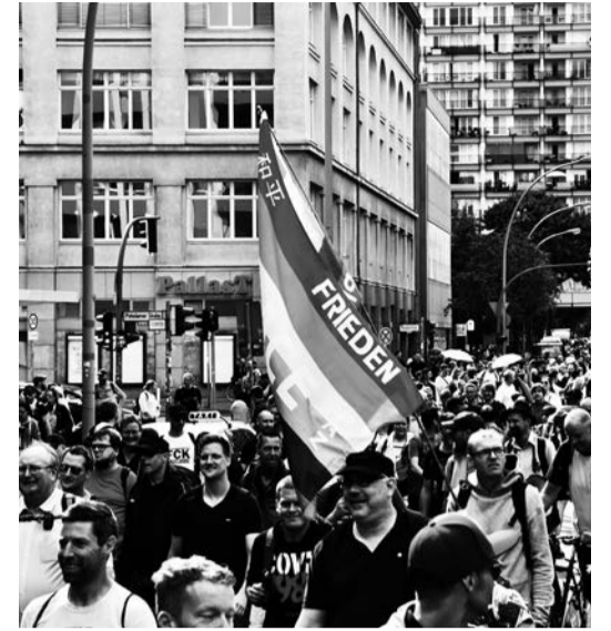
Berlin, 1. August 2021: Demonstrieren, wo es dem Regime am meisten wehtut.

Veranstaltungstermine bitte an die E-Mailadresse veranstaltung@demokratischerwiderstand.de senden. Aktuelle Informationen: https://nichtohneuns.de + NEWSLETTER ABONNIEREN