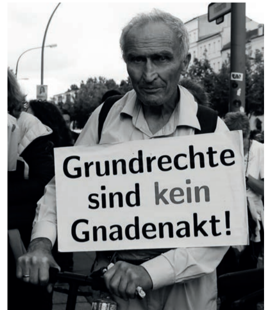
Ein erfahrener Demokrat klärt auf.

Der Staat ist dem Einzelnen nicht übergeordnet, er ergibt sich durch die Summe der Individuen. Sobald er das Individuum brechen will, um sich in Gänze zu erhalten, begeht er Verrat an der Ursprungsidee des Staates. Er bricht den Gesellschaftsvertrag und vertritt den einzigen Vertragspartner, den