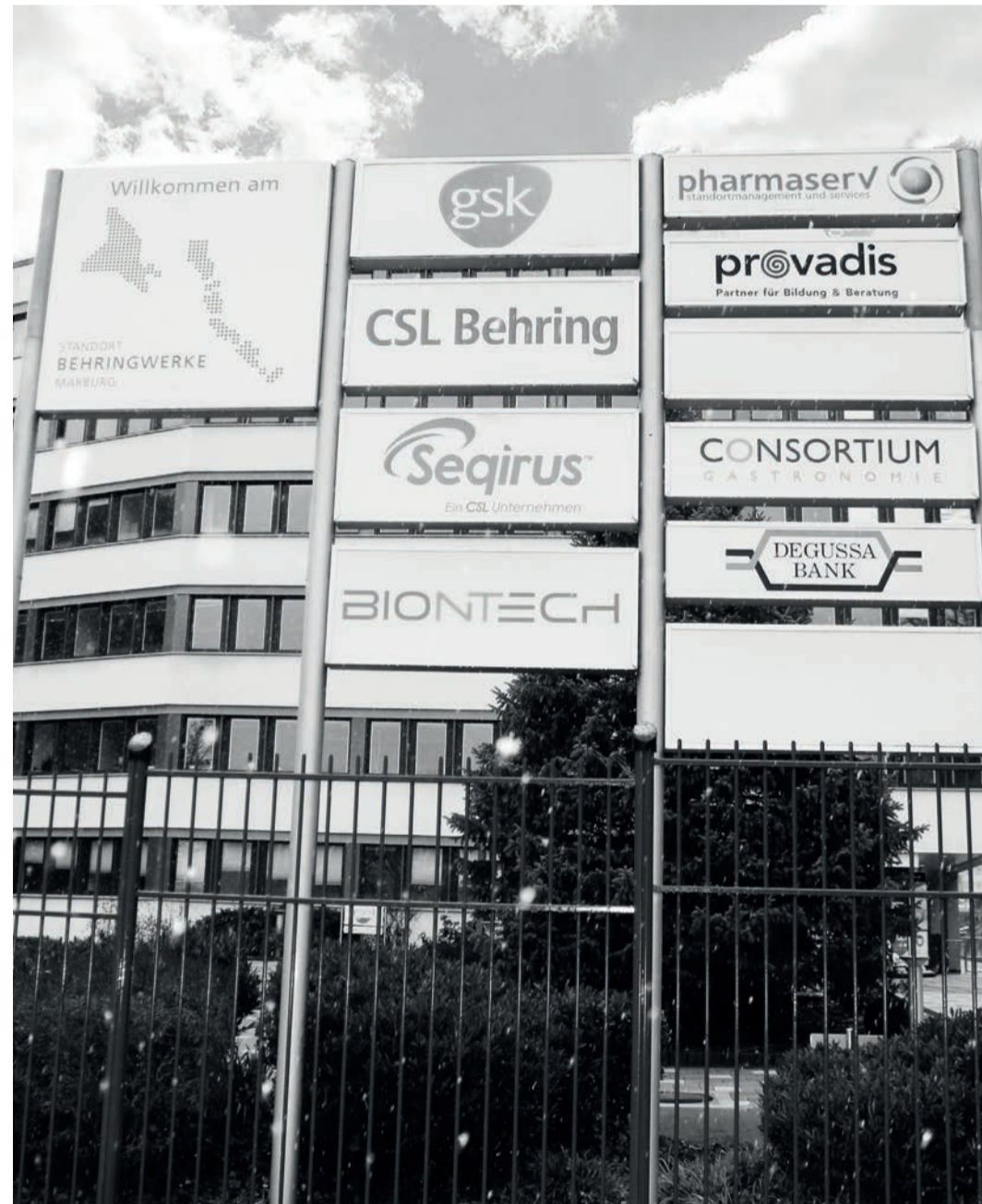
Pharmaunternehmen auf dem Gelände der ehemaligen Behring-Werke in Marburg.

Ugur Sahin kann das locker schultern. Denn sein Unternehmen BioTech wurde im letzten Jahr von Politikern und Medien hemmungslos aufgeblasen zum großen Corona-Hoffnungsträger. Der BioTech-Hype machte das Unternehmen an der Börse höherwertiger als die Deutsche Bank. Das spült frisches Geld in die Taschen. So kaufte Sahin im letzten Herbst mal eben die Novartis-Anteile an den Behring-Werken in Marburg. Die Behring-Werke gehörten früher dem Höchst-Konzern und wurden dann zer-