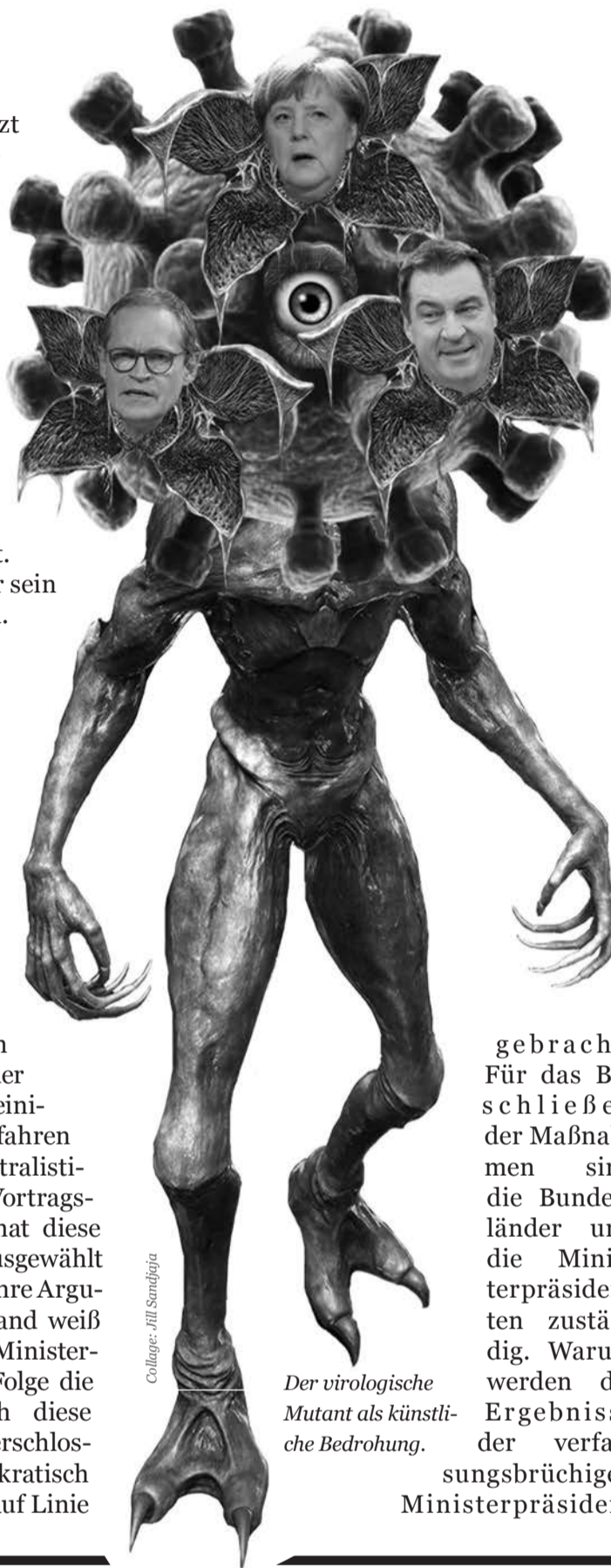
Collage: Hill Sandhija

Für die Beratung in Gesundheitsfragen gibt es in den Landesparlamenten und im Bundestag Gesundheitsausschüsse, die öffentlich tagen. Hier bringen alle in den Parlamenten vertretenen Parteien Positionen ein und stellen Fragen an die Sachverständigen der anderen Parteien. Dieses einigermaßen bewährte Verfahren wird jetzt durch eine zentralistische und intransparente Vortragsreihe ausgehebelt. Wer hat diese acht Wissenschaftler ausgewählt und was sagten sie? Sind ihre Argumente stichhaltig? Niemand weiß es. Im Effekt werden die Ministerpräsidenten und in der Folge die Landesparlamente durch diese Vorgehensweise hinter verschlossenen Türen, undemokratisch und verfassungsbrüchig auf Linie