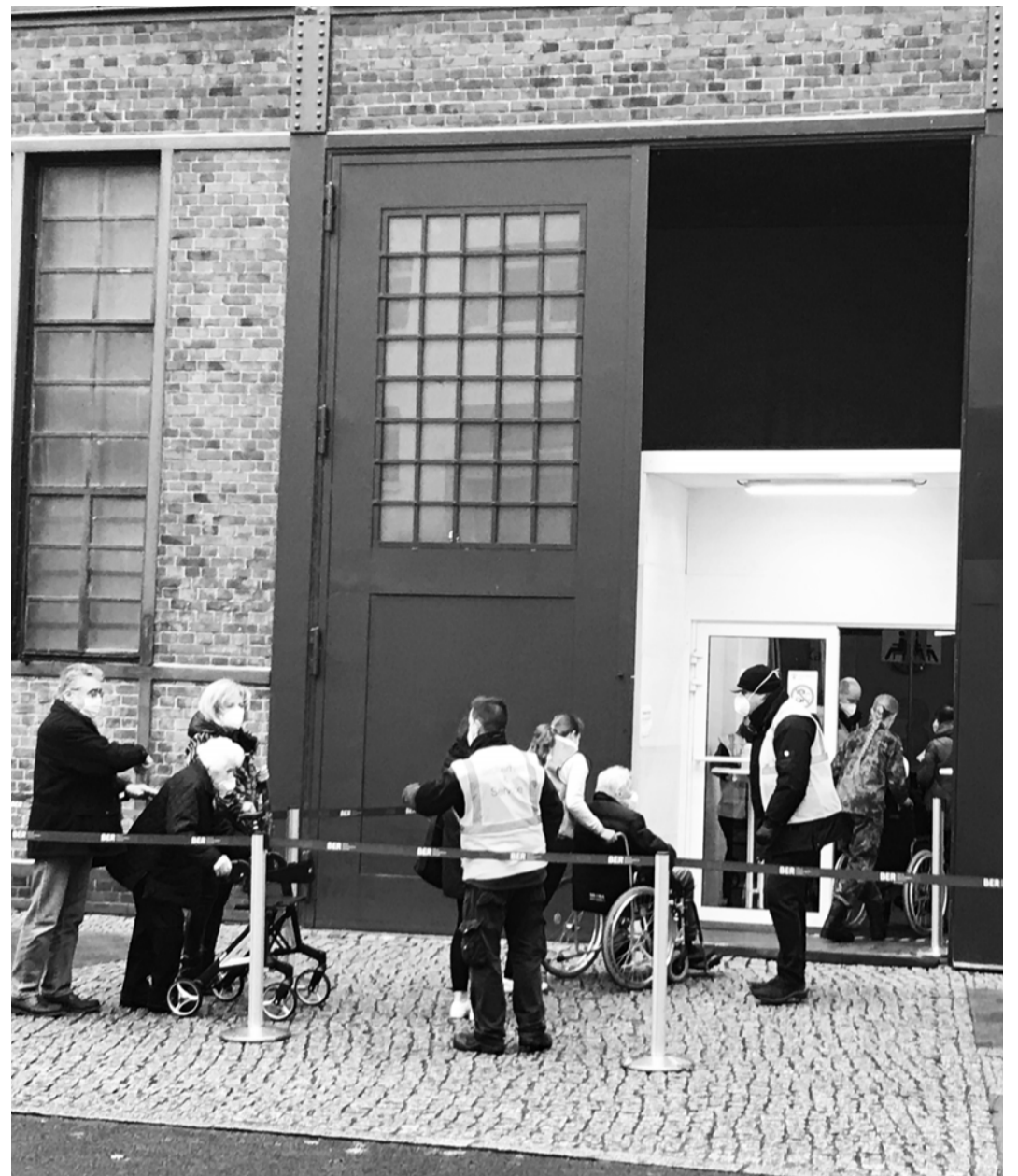
Impfzentrum in Berlin-Treptow mit Einsatz der Bundeswehr im Inland.

So zeigt auch das Mercator-Denkpapier eine bemerkenswerte Unfähigkeit, diese prekäre Situation angemessen zu erkennen. Der Wirtschaftskrieg der USA gegen Deutschland begann nicht erst unter Trump, richtig ungemütlich zu werden. Genannt sei hier nur das äußerst selektive Vorgehen gegen den erpaptten Umwelt-sünder Volkswagen. Industriespionage gegen die deutsche Wirtschaft gehört zum Alltag US-amerikanischer Geheimdienste. Das Stehlen von deutschen Technologie-Geheimnissen. Die Aushorchung der deutschen Bevölkerung ist in diesem Zusammenhang lediglich ein »Beifang«. Darüber schweigt man sich jedoch lieber aus. Von unseren potentiellen Partnern China, USA oder Russland hat keiner der drei nur Samthandschuhe im Umgang mit uns an. Wenn wir nach der Corona-Apokalypse überhaupt noch etwas anzubieten haben, sollten wir uns nach allen Seiten offen und kritisch gleichzeitig zeigen.