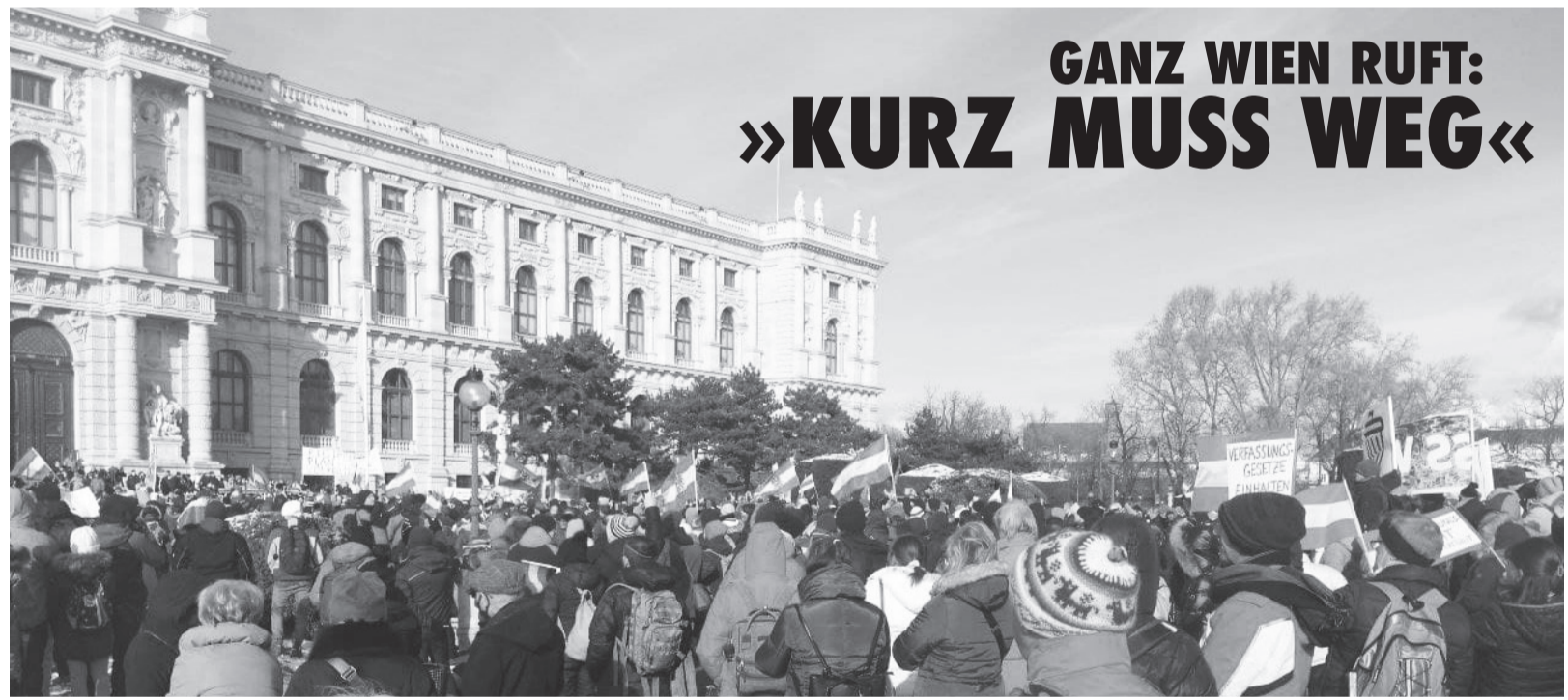
Auch ein Großteil der österreichischen Bevölkerung ist mit den Maßnahmen, die die Regierung-Kurz aufgrund der Covid-19-Erkrankung ergriffen hat, nicht einverstanden. Zehntausende demonstrierten am 16. Januar in Wien für Demokratie und Menschenrechte.

Der vollständige Text der Verfassungsbeschwerde ist online abrufbar auf 2020news.de .