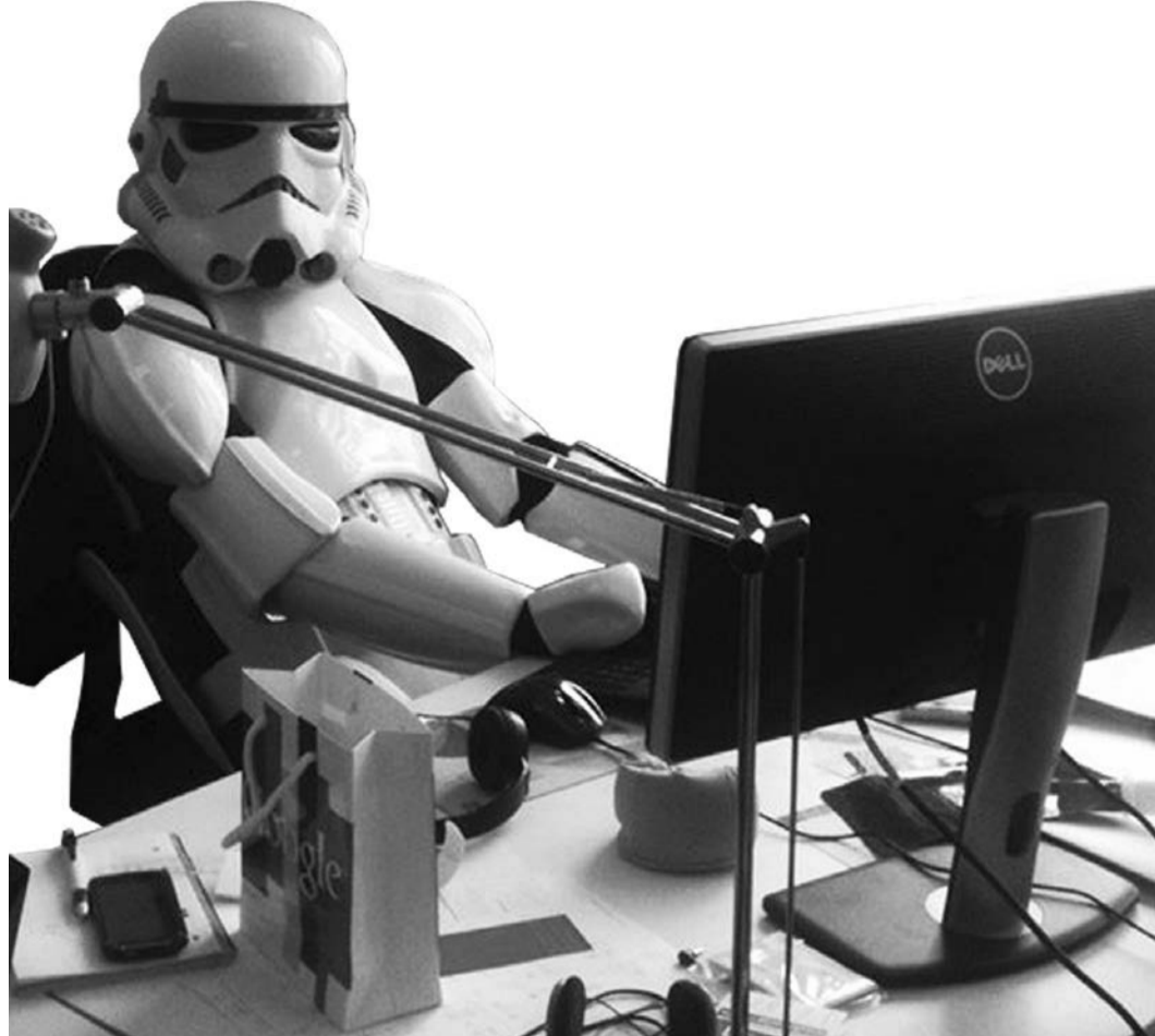
Imperiale Propagandisten: Festhalten am Karrieresystem in der Diktatur?

Seit Beginn der Corona-Krise profitieren die Verlagshäuser massiv vom Verkauf des neuen Produkts »Corona«. Die Nachfrage nach politischer Presse und Wirtschaftstiteln ist deutlich angestiegen, teilt der Arbeitskreis Zeitungs- und Zeitschriftenverkauf mit. E-Paper gewannen über 11 Prozent und die Klickzahlen im Internet haben ungeahnte Höhen erreicht, vermeldet der Bundesverband Digitalpublisher und Zeitungsverleger (BDZV) in seinem Jahresbericht 2020. Auch beim Paid-Content hatten die meisten