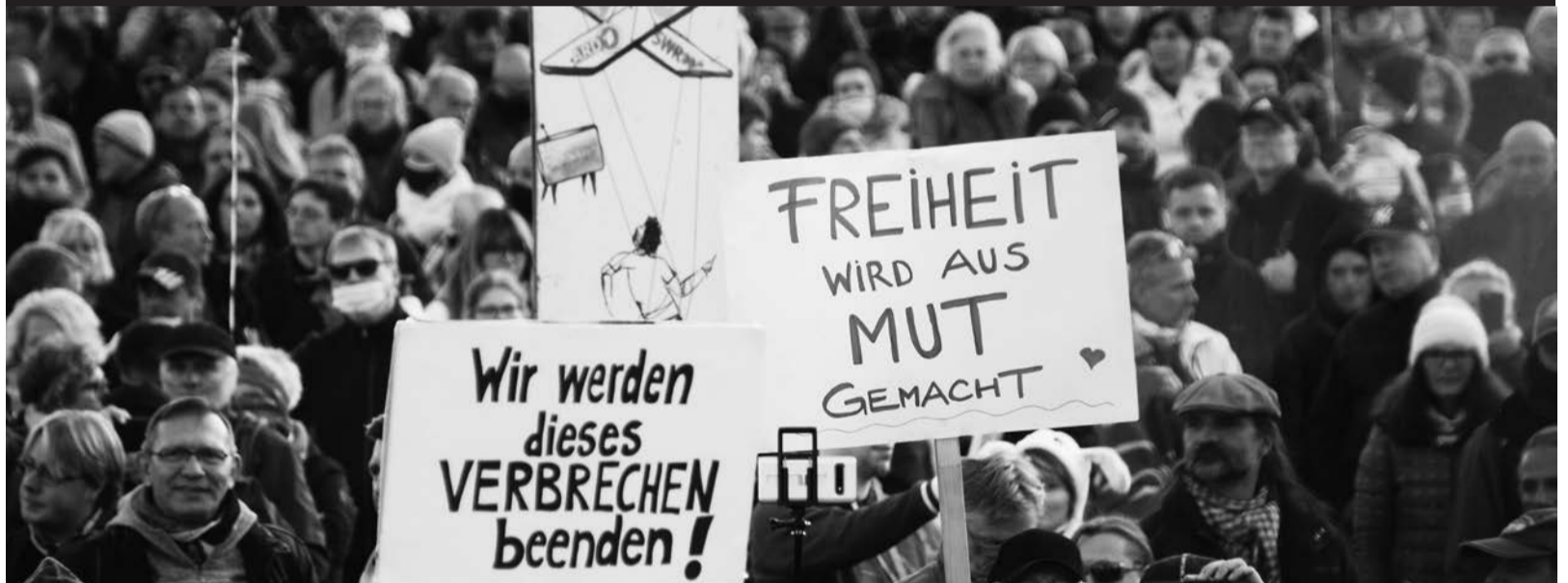
Am 7. November 2020 demonstrierten in Leipzig über 80.000 für Demokratie und Freiheit.

Aktuelle Informationen: https://nichtohneuns.de + NEWSLETTER ABONNIEREN